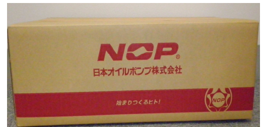
代表的な梱包箱外観