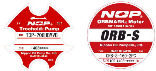
代表的な銘板外観